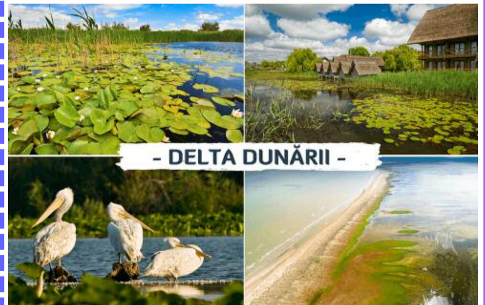
- DELTA DUNĂRII -