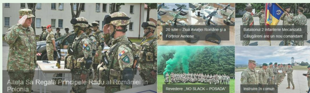
Alteța Sa Regală Principele Radu al României în Poïonia

Publicație editată de Divizia 2 Infanterie „Getica” Bulevardul Mareșal Alexandru Averescu nr. 1, Buzău www.armata-buzau.ro